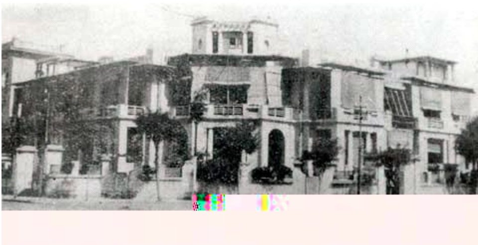
华北水利委员会外景（旧址仍存且已获修复，位于天津市自由 民生 交口西北角）

函示以便接洽”。1931年1月9日，华北水利委员会第67次常务会“决议本会与河北工业学 合办水工试 场各担负开办设备 之一半，由该 拨给场址及由该 挪出一万五千元现款外并由本会于每次 到经 中储存十分之一作为专款 同该 专款交由双方合组之保管，委员会负 保管以作将来建筑及设备之用”。并 成协议：1、河工试 场改称水工试 场，建筑在河北省立工业学 内；2、试 场的规划设计，由工业学 水工讲师李 博士筹办；3、参建单位各尽 力所能，自认投 数 ，差 分协商解决；4、试 场建成后，由 业学 代管，管理办法另定。至此，河北省立工业学 成为最早与华北水利委员会合办水工试 所的学术机关。