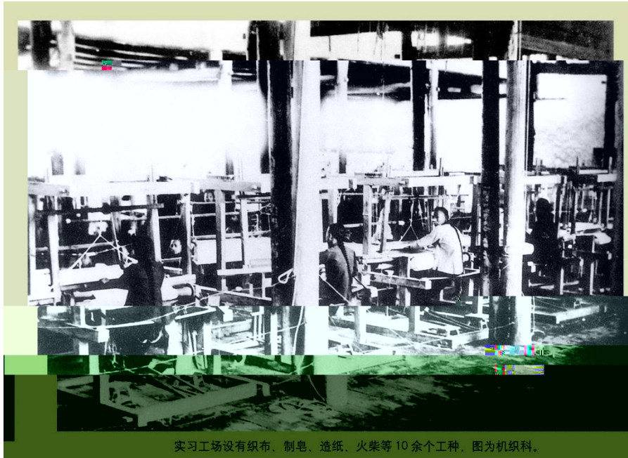
实习工场设有织布、制皂、造纸、火柴等 10 余个工种，图为机织科。

此时实习工场除供工业学堂学生试 制造，主要的是“以推广民间生计为主”，一方 进行商品生产，一方 为民间培养生产技匠，传播推广生产技能。学生当时的实习都是生产型实习，实习产品全部